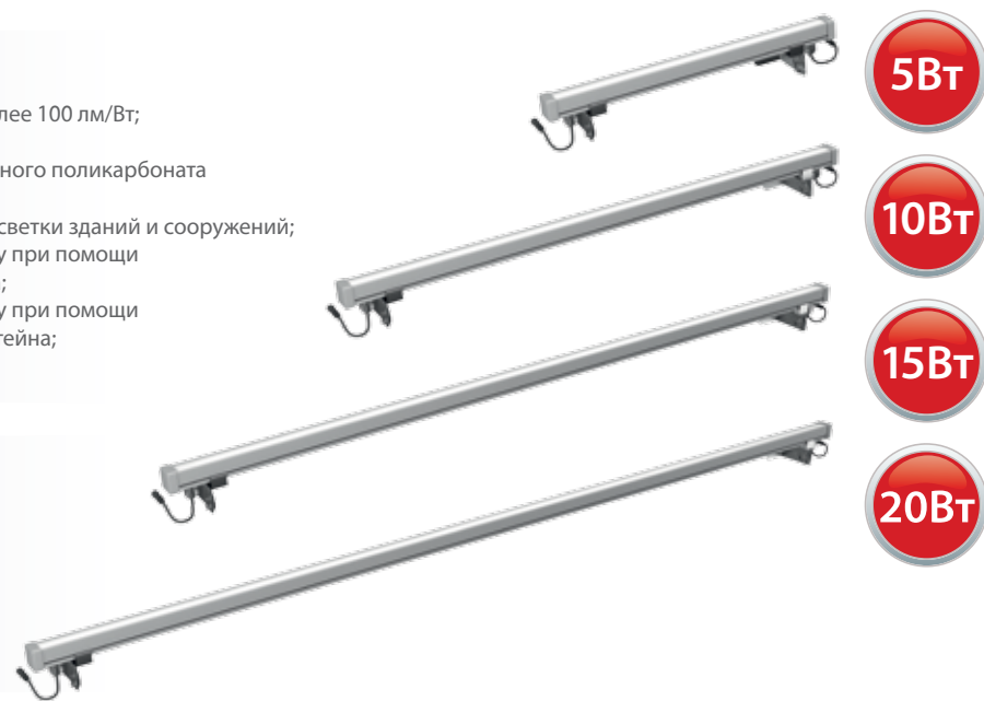
Модификация с прозрачным рассеивателем