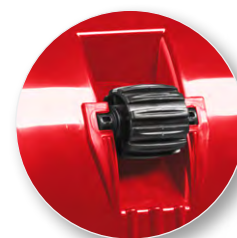
Колеса на оборотной стороне ковша для легкого перемещения