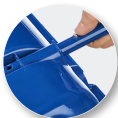
Система быстрого соединения ковша с черенком