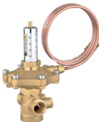
АРТ-R Ду 15-50