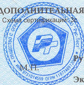
Схема сертификации 3С