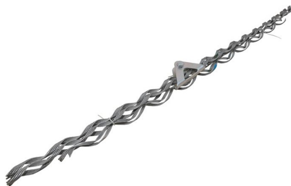
Поддерживающий зажим ПСО

Пример маркировки спиральной арматуры: НСО-20-11.0/12.5П (К-25), где 20 – максимальное натяжение кабеля, кН; 11,0/12,5 – диаметр кабеля, мм; П – наличие протектора; (К-25) – марка коуша входящего в состав зажима.