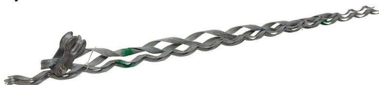
Натяжной зажим НСО

Спиральная арматура в зависимости от модели и максимальной нагрузки состоит из коуша, стальных проволок, защитного протектора. На внутреннюю поверхность спирали нанесен дополнительный абразивный слой для надёжного сцепления с оболочкой кабеля. Для корректного и правильного монтажа зажимы имеют соответствующую цветовую маркировку.