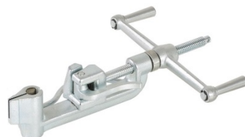
Клещи натяжные для хомутов (МВТ-003)

Для установки креплений на круглые опоры, элементы зданий и сооружений используется специальный инструмент - монтажные (натяжные) клещи МВТ-003. Они позволяют быстро и качественно выполнить работы по сбору надежного узла крепления из монтажной ленты и замка для этой ленты (скрепы). Клещи имеют винтовой механизм который без особого труда позволяет установить монтажную ленту (толщиной до 1 мм) и исключает ослабление ленты перед ее обрезкой клещами и дальнейшей фиксацией скрепой.