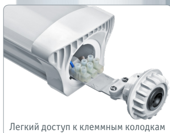
Легкий доступ к клеммным колодкам