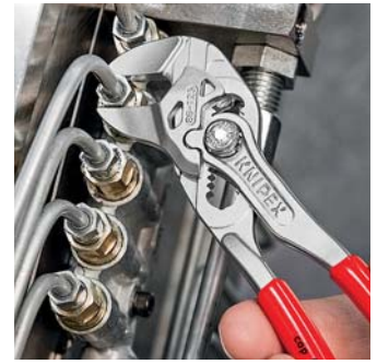
Переставные мини-клещи для точной механики