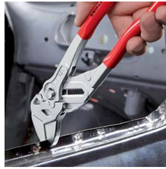
Также отлично подходят для гибки деталей