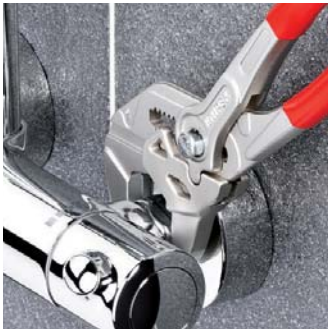
Работы на хромированных деталях без повреждения поверхности