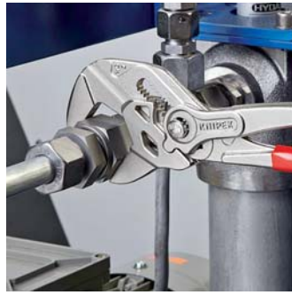
Заменяют полный набор гаечных ключей как метрических, так и дюймовых