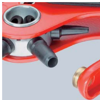
Пуансоны возможно заменять по отдельности