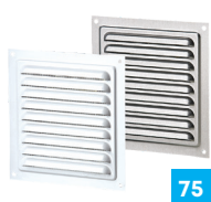
Приточно-вытяжные решётки металлические МЕТ