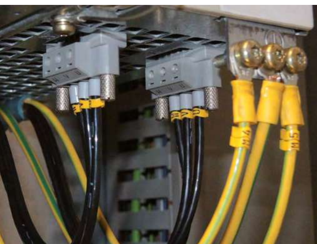
Неправильно закрепленные винты представляют серьезную угрозу безопасности!